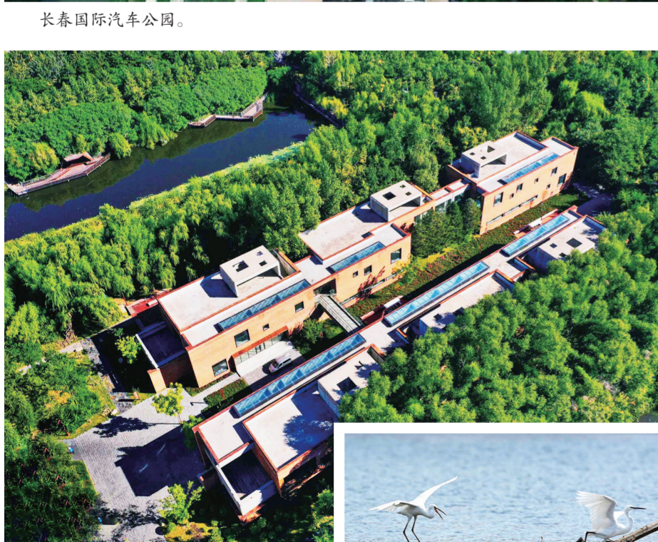
↑长春水文化生态园。