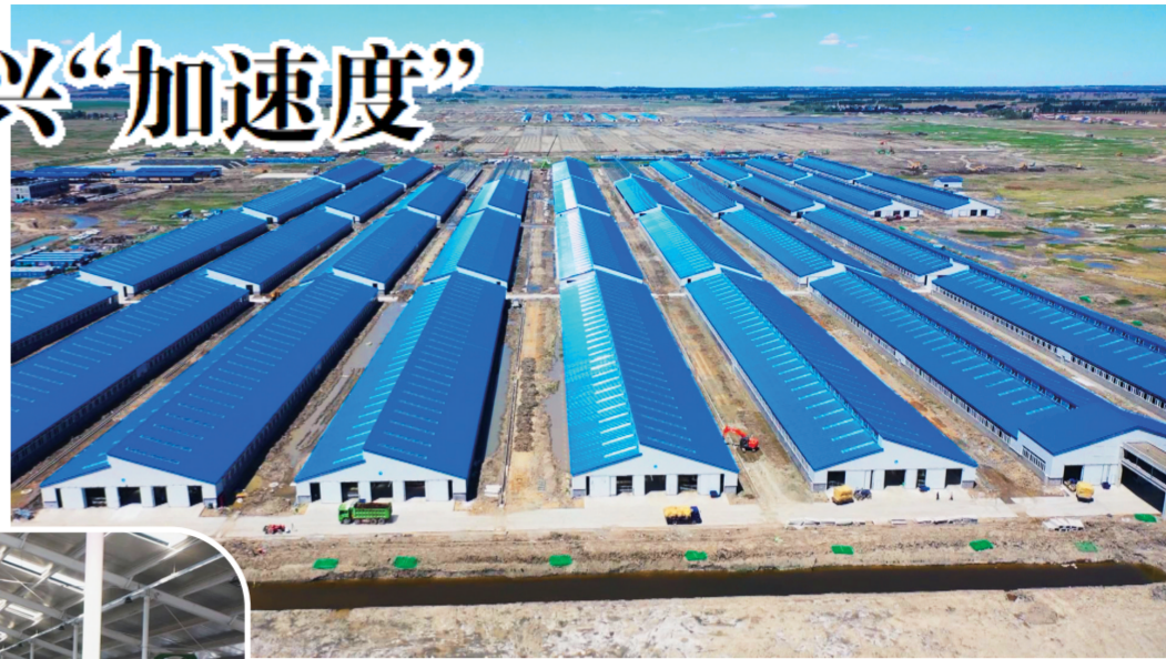
位于农安县巴吉舍镇的肉牛特色小镇。

产研结合促动。鼓励城开农投、成恩牧业、新兆牧业和新兆牧业等龙头企业与吉林农大、省农科院等高校和科研单位联合，建立产学研科研基地，增加肉牛产业的科技含量，提高肉牛品种质量、提高肉牛产业产品的质量、提高肉牛产业附加值，提高肉牛产业的经济效益。目前，农安县畜牧产业信息中心、城开农