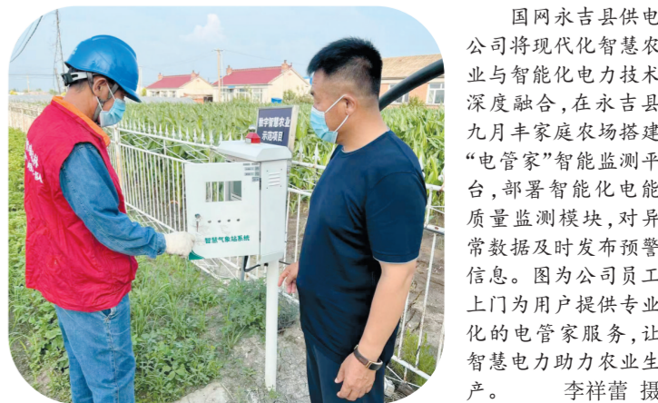
国网永吉县供电公司