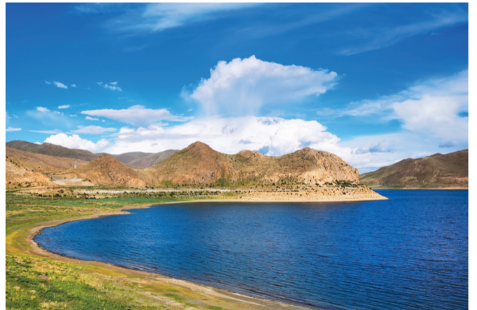
这是7月24日在西藏山南市浪卡子县拍摄的羊卓雍湖景色(手机照片)。羊卓雍湖,藏语意为“碧玉湖”。夏日里的羊卓雍湖,气候宜人,自然风光秀美。