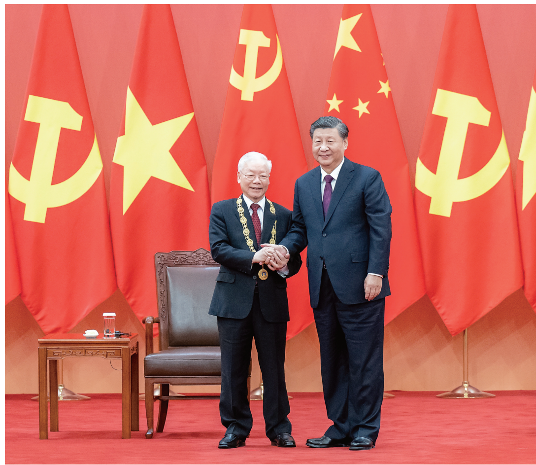
十月三十一日,中共中央总书记、国家主席习近平在北京人民大会堂向越共中央总书记阮富仲授予“友谊勋章”,并举行隆重颁授仪式。