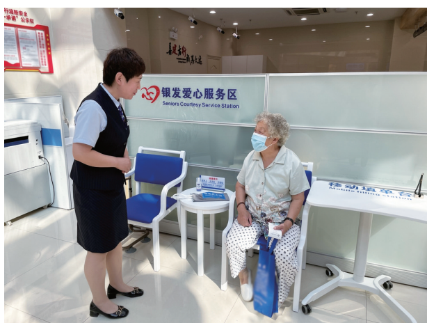
建设银行白城分行营业部服务老年客户。(资料图片)

“平台上线后,二手房网签数据能够实时传送给税务部门进行缴税,大大提高了工作人员的办事效率,过去办理这项业务大概需要40分钟,智慧房产信息平台上线后,可节约一半的时间。”白城市住建局房屋交易中心相关负责人说。