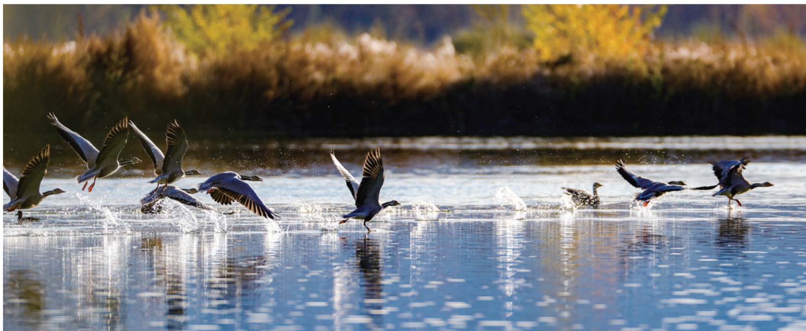
这是11月5日拍摄的拉鲁湿地景色。

近日,随着天气渐寒,位于西藏拉萨市西北部的拉鲁湿地国家级自然保护区呈现出美丽独特的景象。