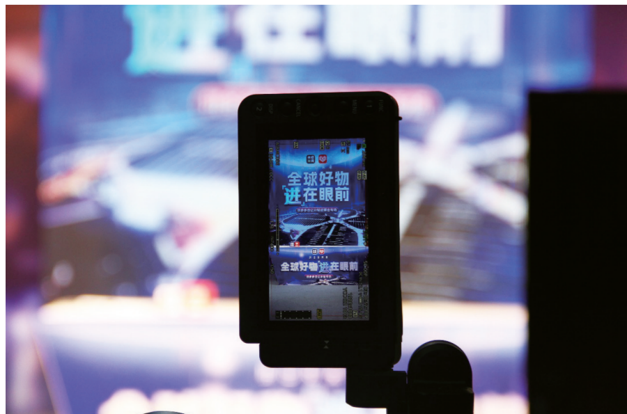
11月5日晚,拼多多联合央视新闻开启长达三个半小时的进博会专场直播,掀起了一轮“进”货热潮。

“进博五年,在央地多重政策支持下,我们加速完善进口生态基础设施,为海外品牌入驻搭建快车道,持续推动跨境电商市场的快速发展。”拼多多全球购负责人表示,一批批“进博尖货”在拼多多上热销,不断飙升的成交数据让海外品牌看到了平台用户的巨大潜力。“我们欢迎更多参展品牌入驻,分享近9亿消费者的大市场,进一步做大进博会的溢出、带动效应。”