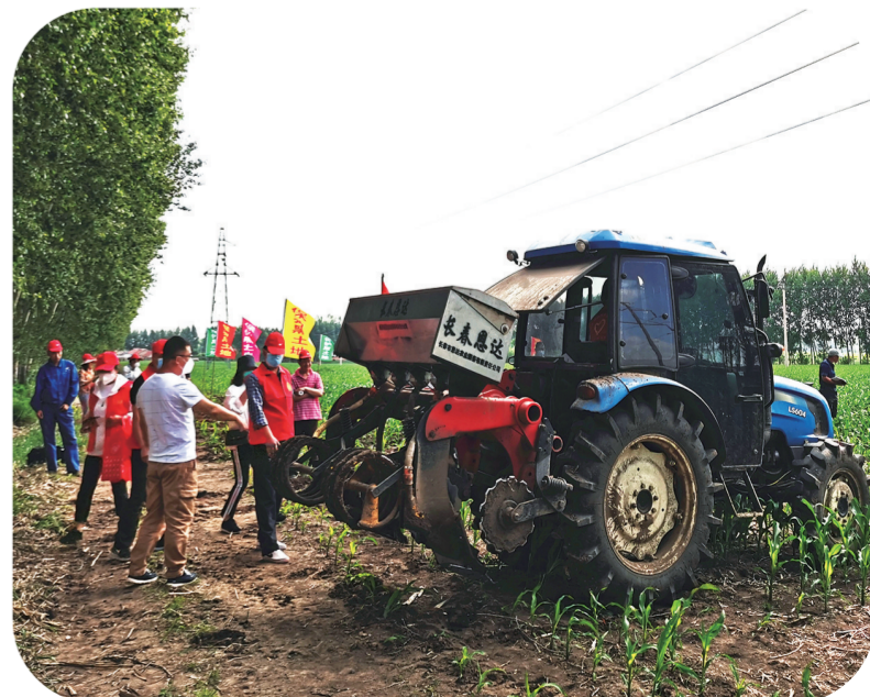
九台区开展“农业专家帮帮团”志愿服务活动。

九台,很精准! 建立一插到底的应急指挥体系,深入落实包保责任制,坚持组织建设与应急指挥体系全面延伸到小区(村屯)最小单元,建立全方位疫情防控线,保障人民群众生命安全。实施“四级包保”机制,区级领导包保乡镇街道,乡镇街道班子成员包保村社区,区直部门包保小区,机关干部包保到楼栋,社区安全防线进一步牢固。同时围绕9个方面60个具体任务,分级建立实事项目,区级领导带头围绕涉及小区难点