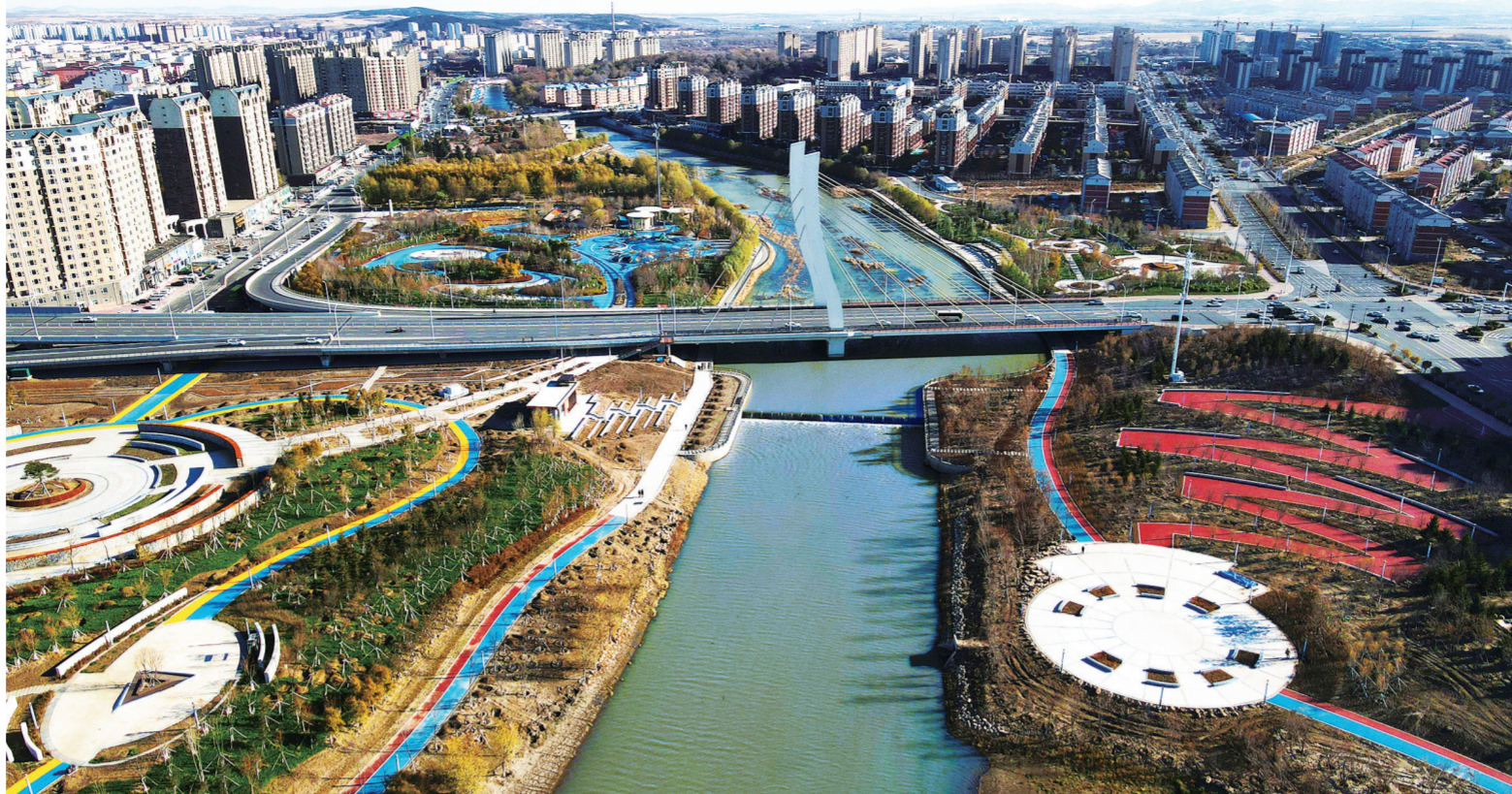
九台区加快推进小南河综合治理项目,提升群众幸福指数。

5个多月、170多天,九台区以“四个服务”为突破口,创新各项举措,释放澎湃动力,在推进“1728”工程的征程上勇闯新路,显现出发展的强大韧性和蓬勃生机。