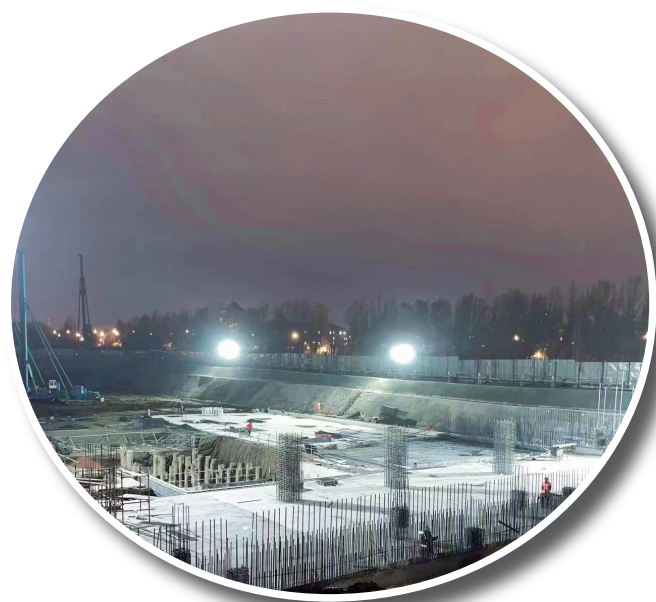
华为吉林区域总部项目正在连夜施工。

如今，已经进入项目建设的冲刺阶段，为抢抓项目建设进度，南关区深入贯彻落实稳住经济一揽子政策，强化自身服务意识，运用“五化”闭环工作法，列出序时进度、投资目标、项目问题“三项清单”，坚持“一企一策、一项一策”，扎实做好项目建设各项工作的同时，通过多方联动、多措并举、多点发力为项目建设提供有力保障，通过专班推进、专题研究、专项解决打通项目建设的“最后一公里”，质效并重，使南关区成为项目落位的“强磁场”。