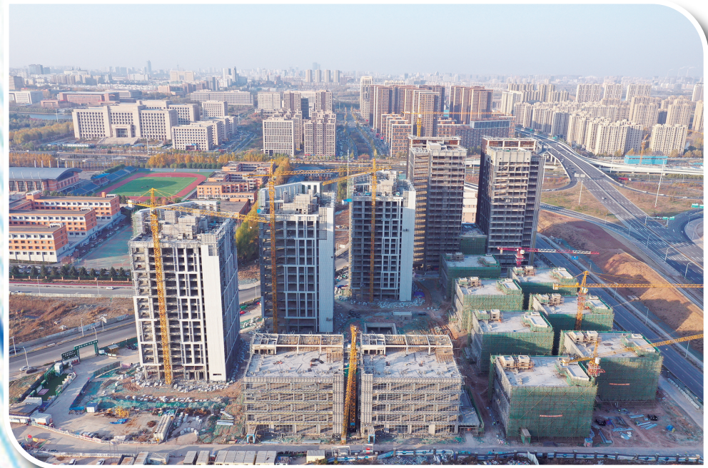
南溪智融项目鸟瞰图。