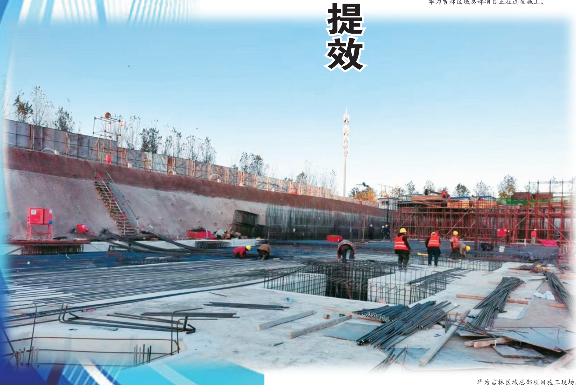
华为吉林区域总部项目施工现场。