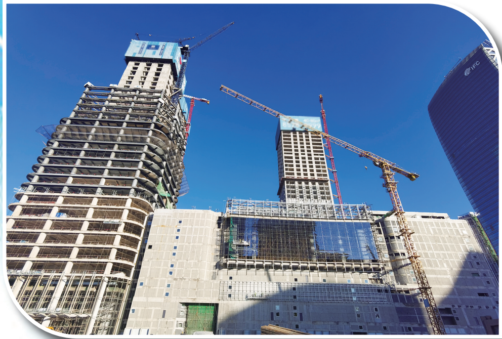
华润中心项目施工现场。