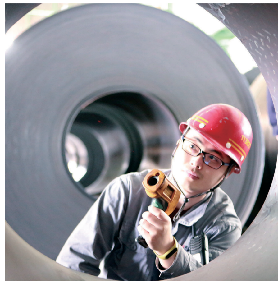
在吉林建龙钢铁有限公司生产现场,检验员用精密仪器检测精轧花纹钢板产品质量。凌西政 摄